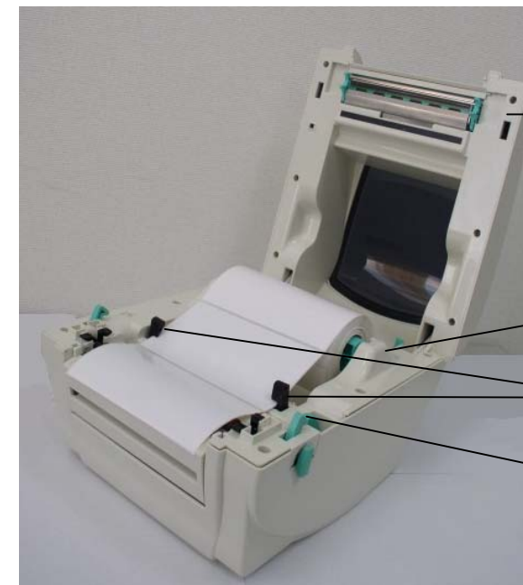
Верхняя крышка принтера